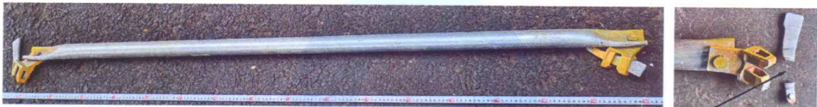
VỊ TRÍ HỒNG